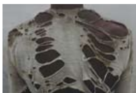
Gilles Saussier, Utopie, dos d'un paysan sans terre, Noakhali (série Living in the fringe), 1996