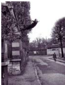
Yves Klein, Le Saut dans le vide , 1960