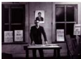
Henry Flynt donnant une conférence, New York, 1963

Répondre à cette question, c'est asséoir cette autre nécessité: pourquoi démocratiser la culture ? Pourquoi « élargir le cercle des connaisseurs » ?